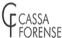
image002.png 10 KB